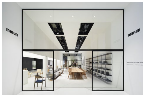
2019年ミラノサローネ会場風景