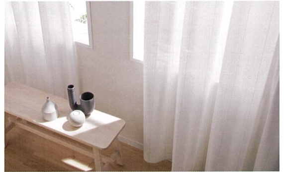
室内の暑さ対策に。室外からの熱を約50%カットする超遮熱レース