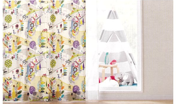
遊び心のあるデザインを、インクジェットプリントで表現したシリーズ