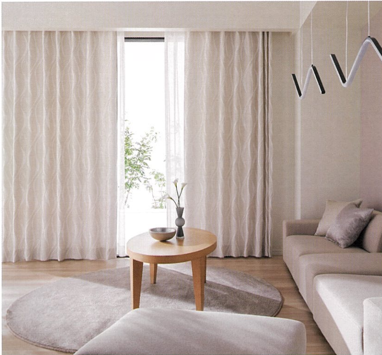
低彩度のカラーやグレー系のインテリアに合わせやすい、トレンドのソフトカラーで展開したシリーズ

上品で洗練された空間を演出できるアイテムをはじめ、ワクワクするような楽しいデザイン、暮らしを快適にする機能性など、お客様のライフスタイルに新しい提案ができる、アスワンならではのカーテンを取り揃えました。