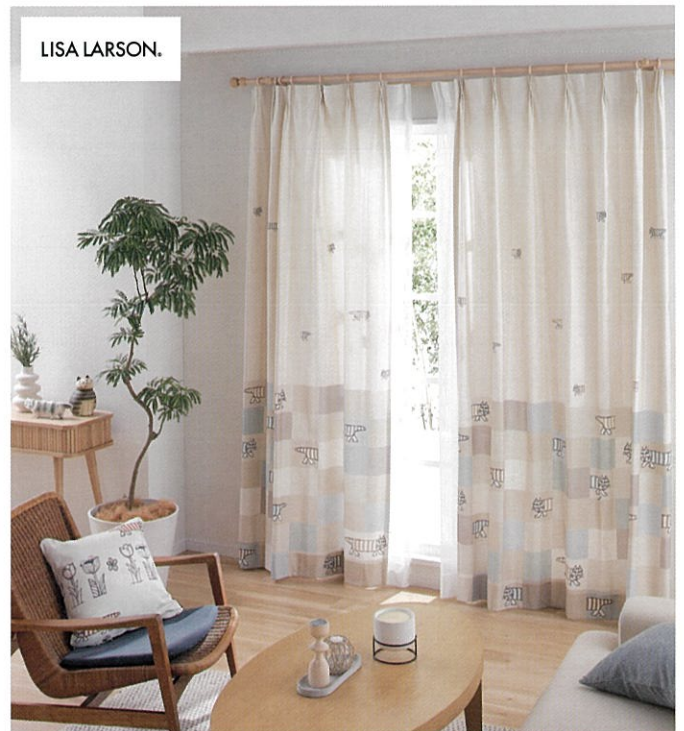
ユーモラスな表情が愛らしい「マイキー」をプリントしたカーテン